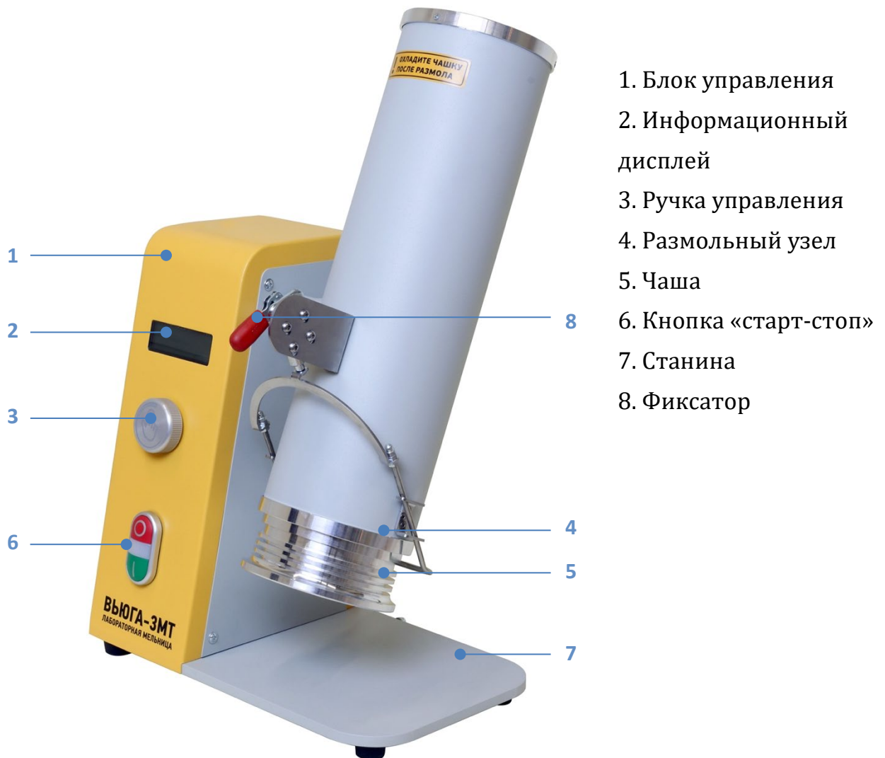
Рис. 1. Общий вид мельницы