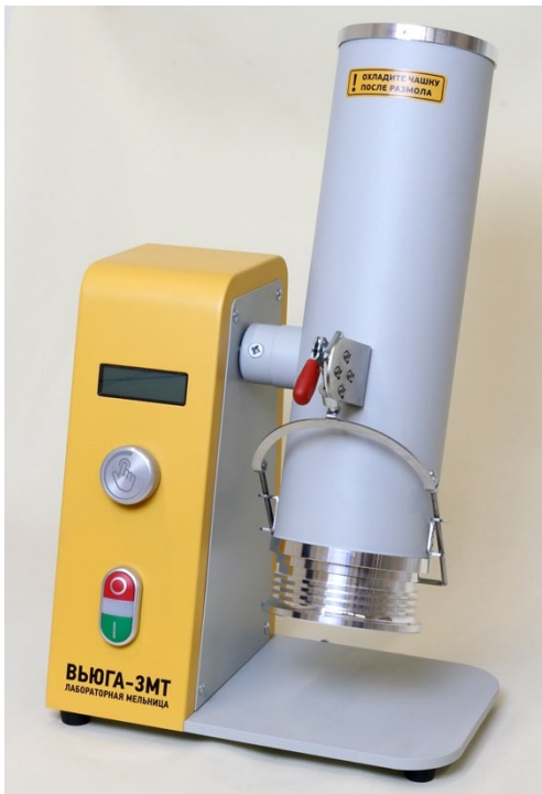
Рис. 3. Положение размольного узла при загрузке и выгрузке проб

** При повороте могут издаваться звуки. Не является неисправностью.