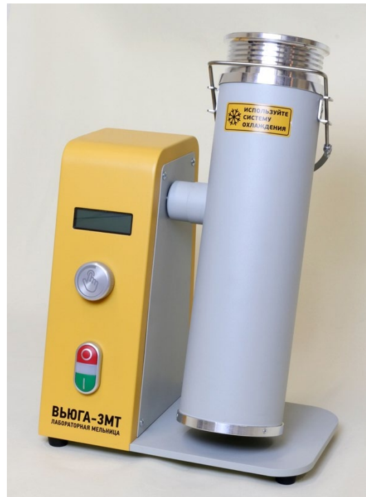
Рис. 4. Положение размольного узла при размолке проб (рабочее положение)

После нажатия кнопки «старт» размольная камера начинает подниматься в рабочее положение с одновременным началом вращения ножей. Размольный узел циклически вращается до завершения заданного времени измельчения пробы. На этапе возвращения размольной камеры в положение загрузки/выгрузки, кратковременно возобновляется размол для снятия образца со стенок размольной камеры. Оставшееся время измельчения отображается на информационном дисплее.