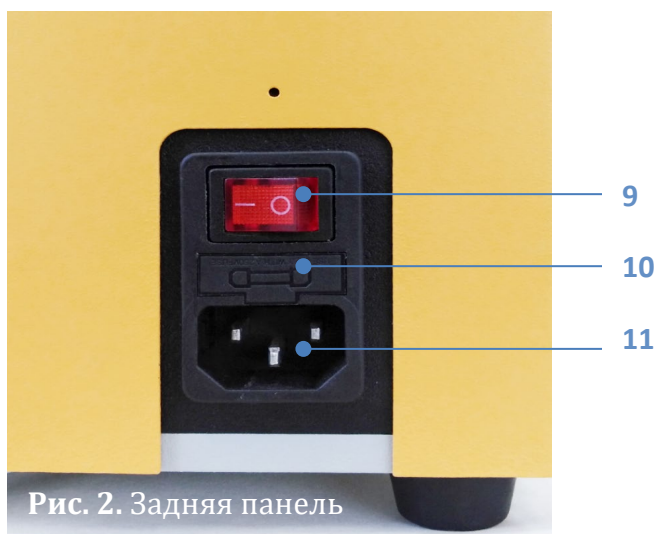
Рис. 2. Задняя панель