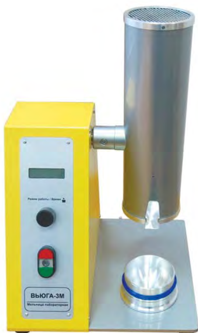
Рис. 3. Положение размольного узла при загрузке и выгрузке проб