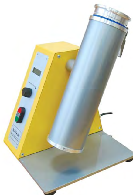
Рис. 4. Положение размольного узла при размоле проб (рабочее положение)

При выборе режима «подсолнечник» процесс измельчения осуществляется в два этапа: